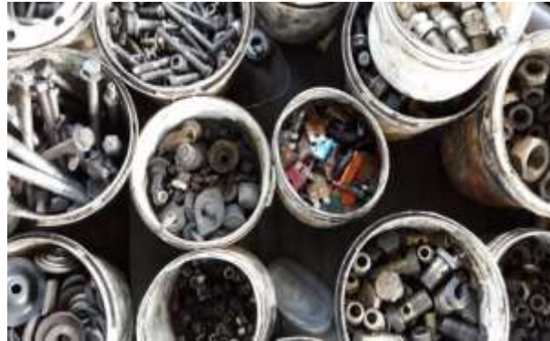
Figura 4. Disolventes y combustibles residuales

Residuos sólidos: Este tipo de residuos se los asocia de forma directa al almacenamiento deficiente de este tipo de talleres en general, por ejemplo la utilización de fundas plásticas que no están diseñadas para realizar la contención de sustancias peligrosas permite que se facilite las filtraciones, esto sumado al mal manejo que se tiene de los envases de productos químicos que se los utiliza después de algún mantenimiento o en algún proceso de revisión del automóvil por lo que son desechados sin ningún cuidado adecuado.