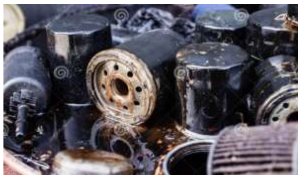
Figura 3. Filtros de aceite contaminados

Derivados disolventes y combustibles residuales: Este tipo de líquidos que son derivados de los solventes, están implícitos durante las actividades que deben tener que ver con los mantenimientos que se realizan en los talleres, por lo que la disposición de estos suele incluir procedimientos de vertido en el suelo o si no de forma directa en los sistemas de alcantarillado que desemboca en algún