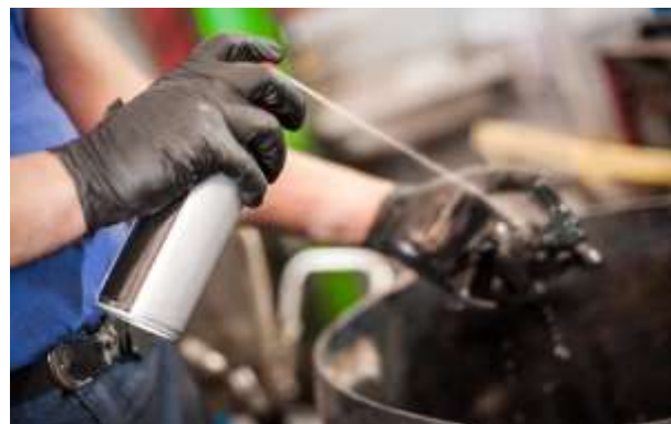
Figura 5. Residuos sólidos

Daños ambientales: Los daños asociados con la eliminación no adecuada de estos desechos contaminantes traen consecuencias en ciertos aspectos, pues al ser eliminado de forma inadecuada estos llegan a liberar sustancias químicas tóxicas en ciertos elementos pudiendo causar un daño de forma indirecta hacia las personas con el paso del tiempo.