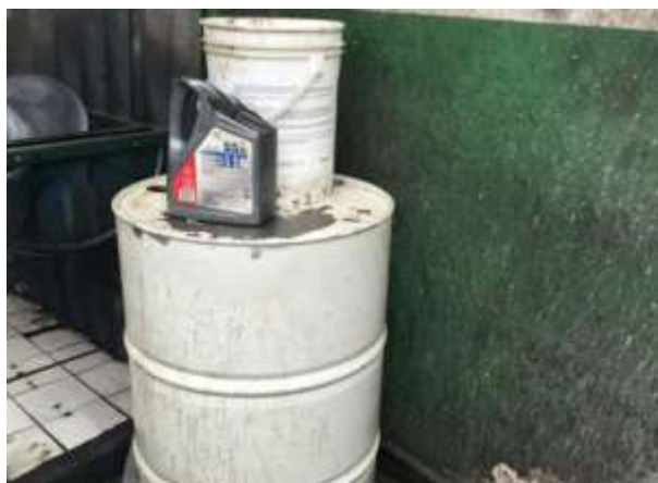
Figura 2. Aceites lubricantes

Filtros de aceite contaminados: Este es otro de los contaminantes que se generan en los talleres, cuando se realicen los mantenimientos desechándolos que se retiran de los automóviles, en algunos talleres se los suelen entregar a empresas que son autorizadas en su tratamiento sin embargo hay otros casos en los que se los tira a la basura común sin ningún tratamiento previo generando contaminación del suelo. Este tipo de residuos presentan hidrocarburos y ciertos aceites que se encuentran retenidos por lo que son contaminantes muy fuertes para el medio ambiente.